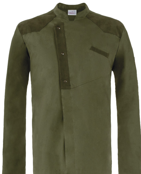
102 Verde militare